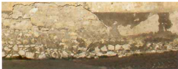
Figura 2 - esempio di distacchi dovuti all'impiego di diversi materiali.

Si parla di incompatibilità di tipo fisico-meccanico quando non è rispettata la regola della crescente elasticità e porosità tra gli strati, dal più interno (meno elastico e meno poroso) al più esterno (che avrà elasticità e porosità uguale o maggiore agli strati più interni).