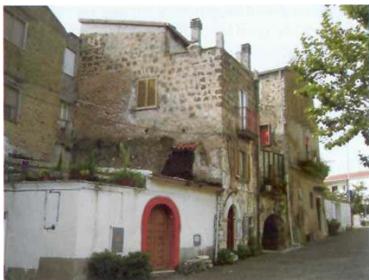
Figura 3 - fronte eterogeneo per materiali impiegati nelle costruzioni

Ritornando allo studio dei materiali, riportiamo alcune indicazioni sui litotipi più utilizzati nell'area presa in esame. Le pietre a componente calcarea sono particolarmente sensibili all'aggressione provocata dall'anidride solforosa e solforica.